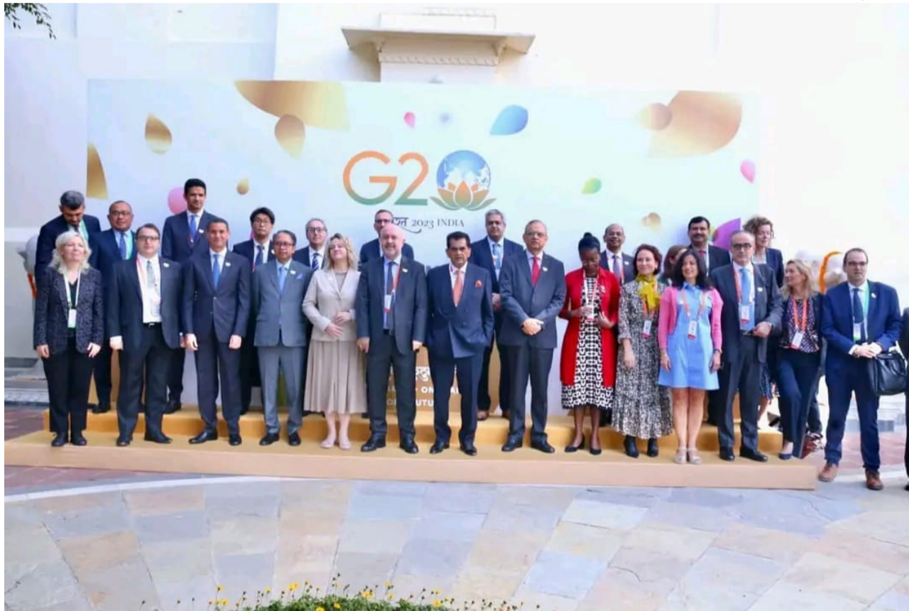
الاجتماع الأول لممثلي قادة الدول والحكومات بمدينة أودايبور الهندية