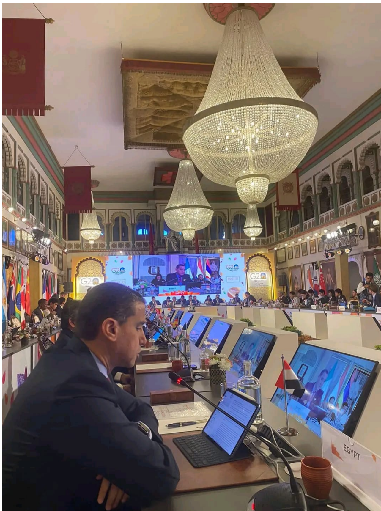
الاجتماع الأول للممثلة قادة الدول والحكومات بمدينة أودايبور الهندية

وتتولى وزارة الخارجية مهام التنسيق الوطني فيما بين الوزارات والجهات المصرية المشاركة في الاجتماعات القطاعية لمجموعة العشرين، حيث أنه من المقرر مشاركة وفود رفيعة المستوى من الوزارات المختلفة في اجتماعات قطاعية للمجموعة خلال الفترة القادمة.