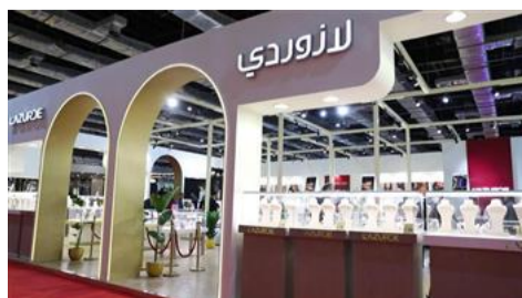
«لازوردي» تختار النجمة باسمين عبد العزيز كسفيرة للعلامة التجارية في الشرق الأوسط