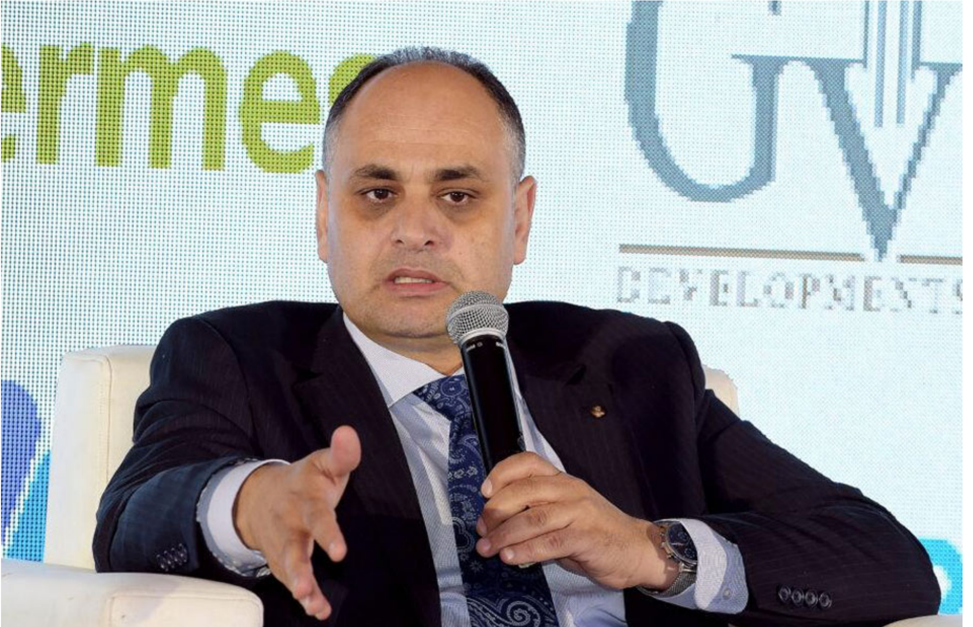
الدكتور علي أبو سنة الرئيس التنفيذي لجهاز شؤون البيئة