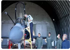
Yunanistan'da şamata dinmiyor: 'Miçotakis'in yaban tavşanı'

'Birbirimizi tehdit etmemiz, üst uçuş veya bunun gibi kaza riskini artıracak provokatif eylemlerde bulunmamız gerekiyor. Çok zor zamanlarımız olmuş olsa da Cumhurbaşkanı Erdoğan ile çözümün imkansız olduğunu düşünmüyorum'