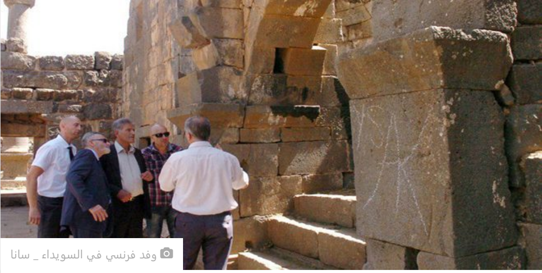
وفد فرنسي في السويداء

تداولت صفحات محلية اليوم خبراً مفاده أن "فرنسا" سمحت لمواطنيها بزيارة "سوريا" بغرض السياحة اعتباراً من 1 حزيران المقبل.