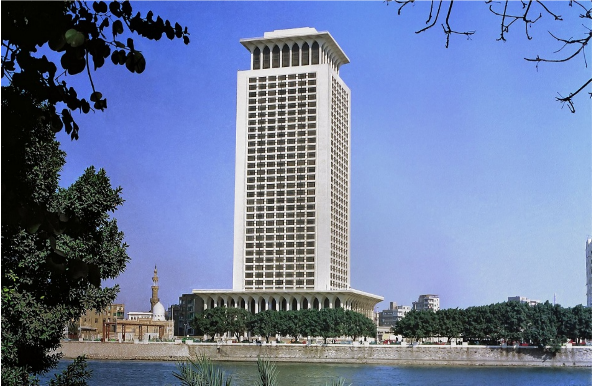
وزارة الخارجية المصرية