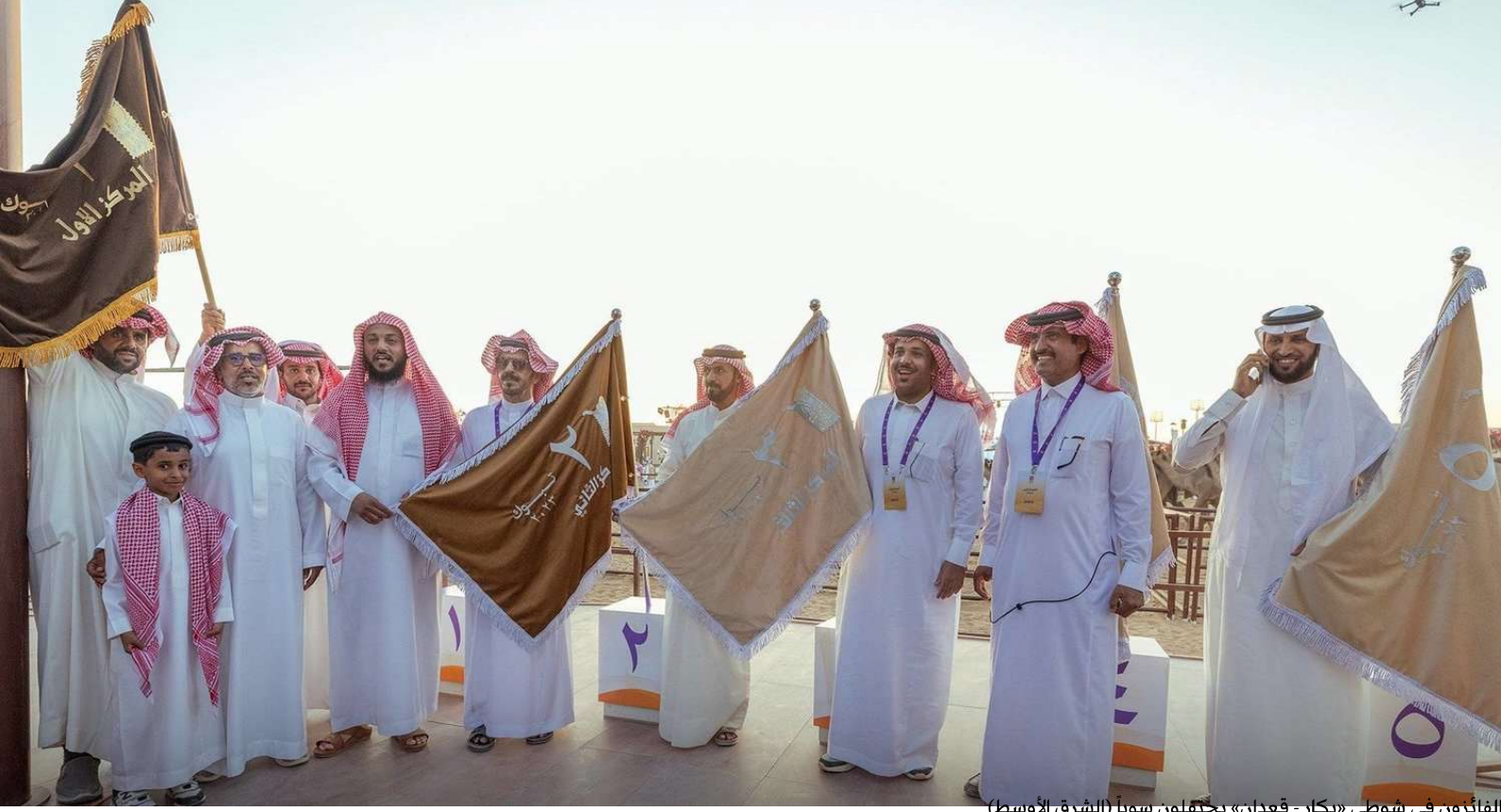
الفائزون في شوطي «بكار - قعدان» يحملون سوياً (الشرق الأوسط)

أعلنت لجنة التحكيم النهائي بمهرجان «جادة الإبل بتبوك» نتائج الفائزين في شوطي «بكار - قعدان» لفئة حيران للون الوضح. فيما أطرب نادي الإبل جماهير المهرجان بإقامة حفل كلاسيكي مميز للفنان السعودي خالد عبد الرحمن الملقب بـ«مخاوي الليل».