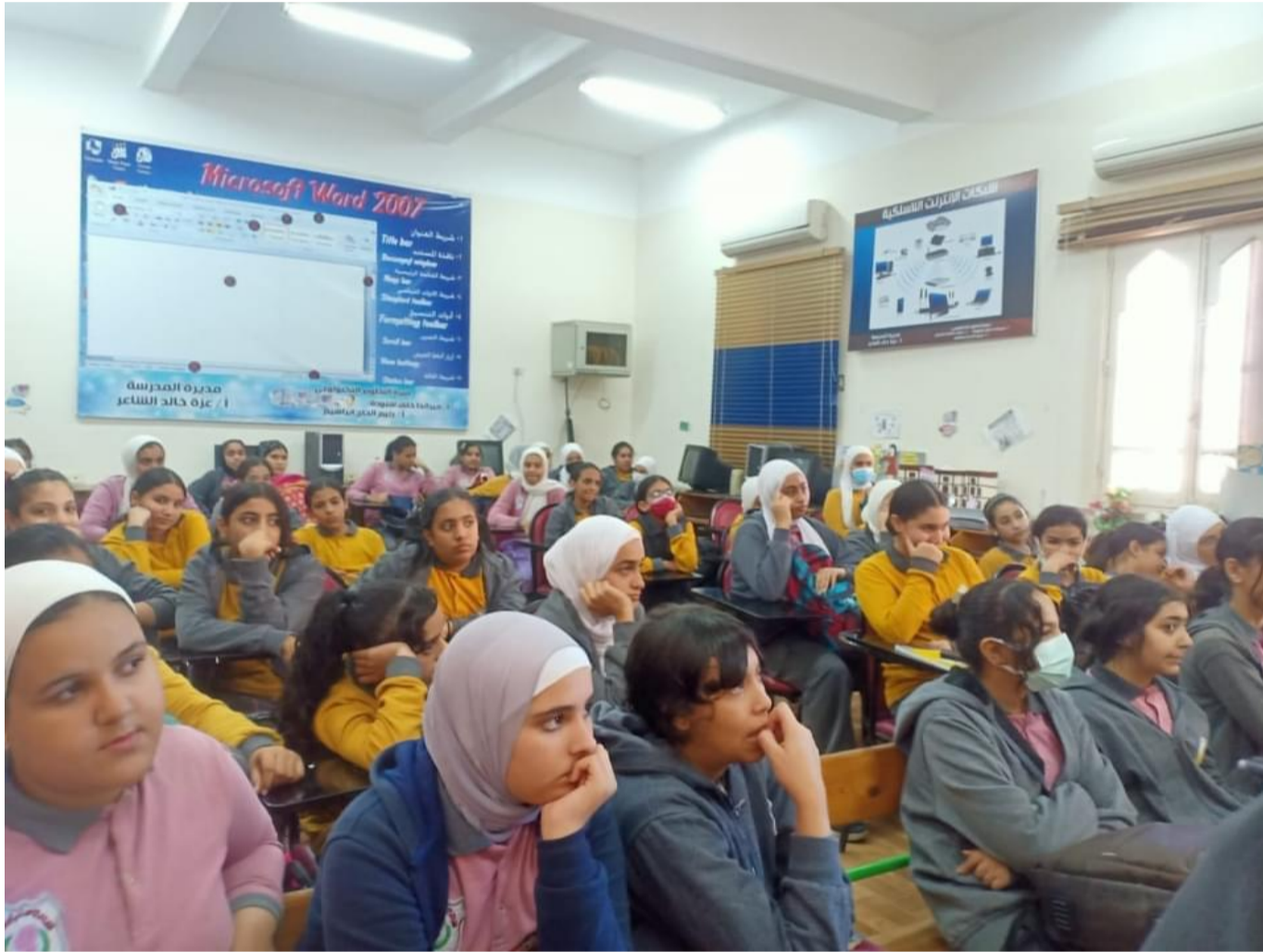
طالبات مدارس - أرشيفية