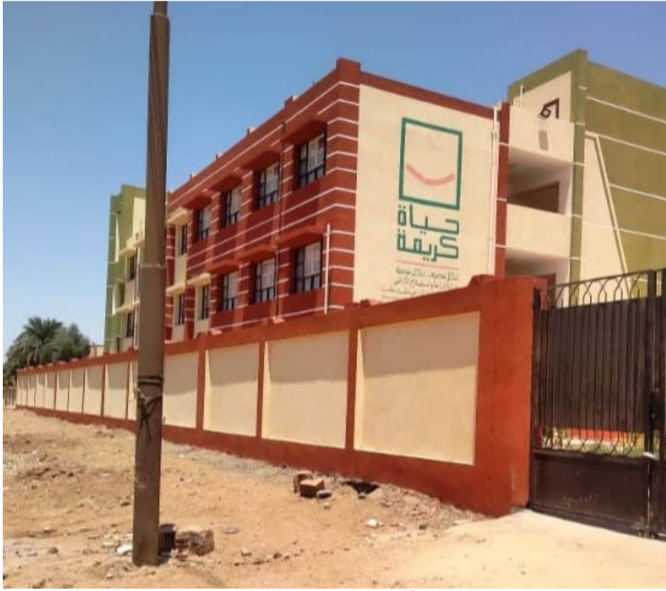
إنجازات غير مسبوقه للتعليم في أسوان