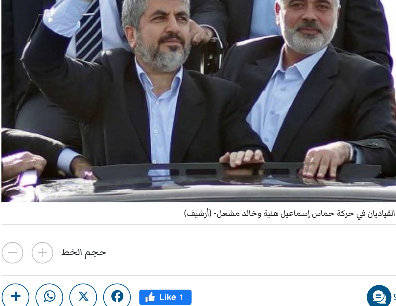
القياديان في حركة حماس إسماعيل هنية وخالد مشعل