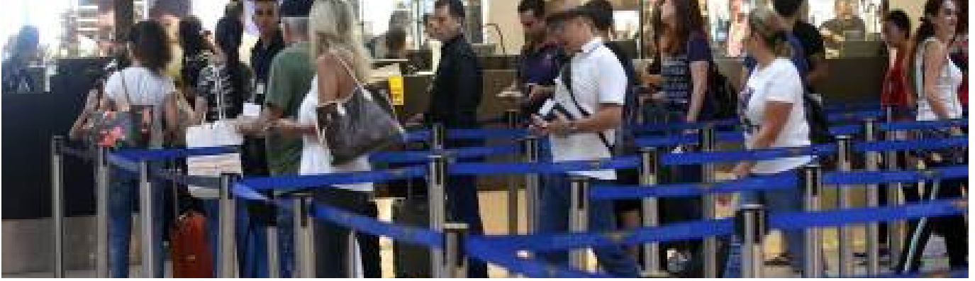
ارتفاع أعداد الوافدين إلى لبنان (علي علوش)