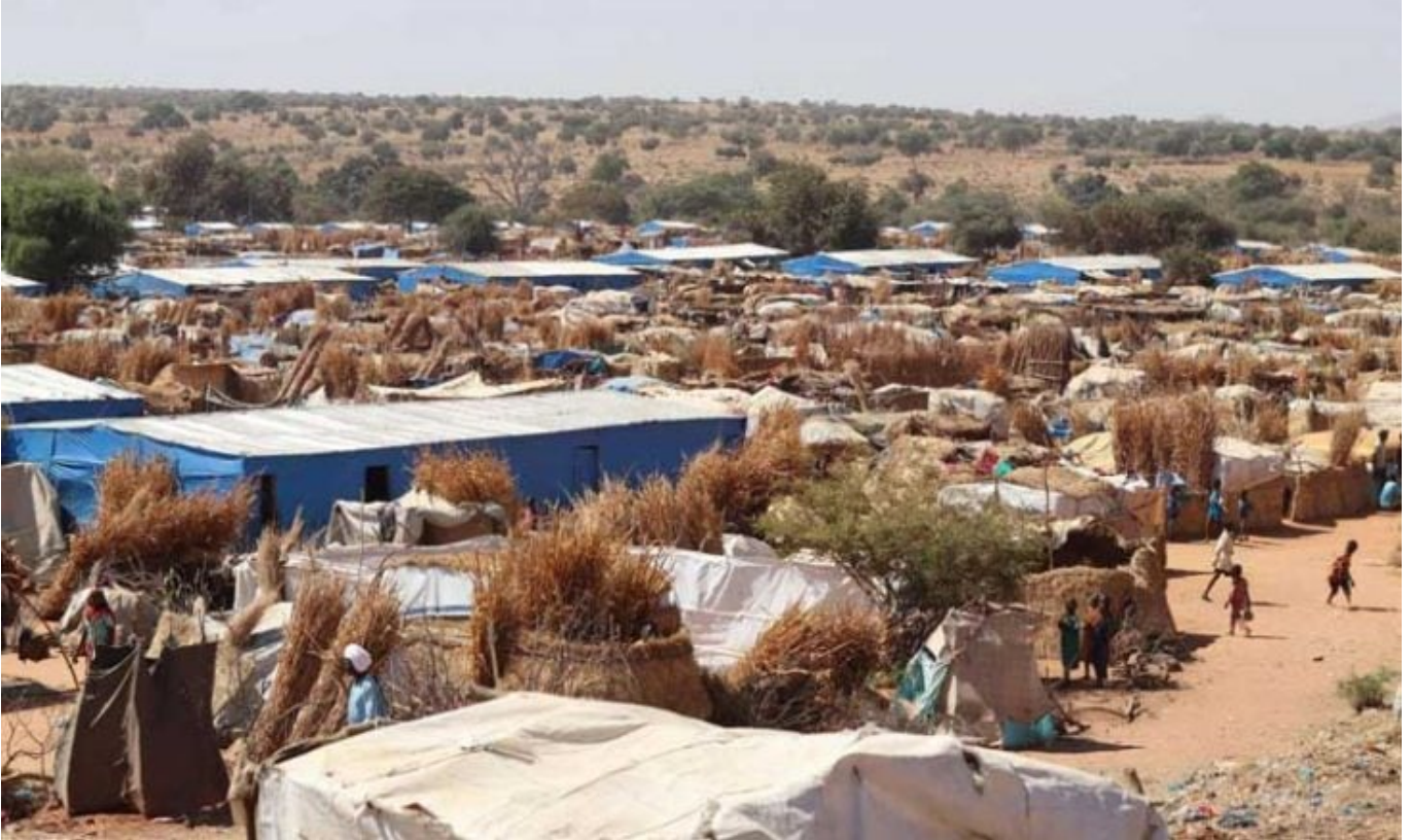
مخيم للنازحين من الحرب في السودان

أديس أبابا- "القدس العربي"- وكالات: قال مندوب السودان لدى الأمم المتحدة، الحارث إدريس، إن "قوات الدعم السريع تجلب مرتزقة وأسلحة عبر الإمارات".