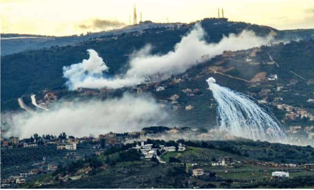
دخان يتصاعد أثناء القصف الإسرائيلي على إحدى القرى في جنوب لبنان

بيروت: أعلنت "حركة أمل" اللبنانية، فجر السبت، مقتل اثنين من عناصرها في المواجهات مع جيش الاحتلال الإسرائيلي جنوبي لبنان، ليرتفع عدد قتلها إلى 3 منذ 8 أكتوبر/ تشرين الأول الماضي.