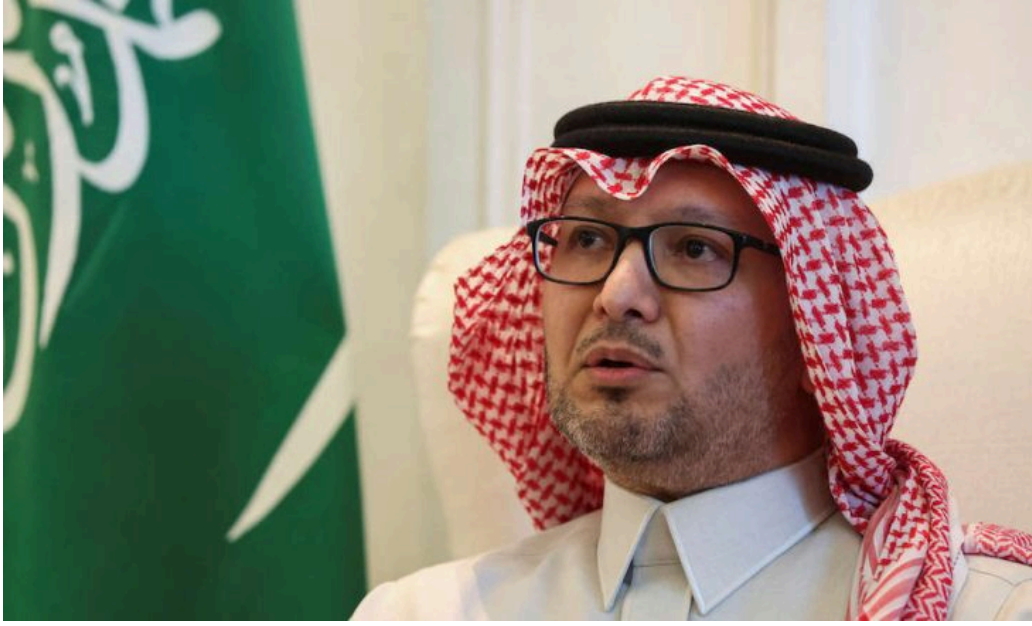
السفير السعودي لدى لبنان وليد البخاري

الرياض: دعت السعودية، اليوم السبت، مواطنيها الموجودين في لبنان إلى مغادرته بشكل فوري.