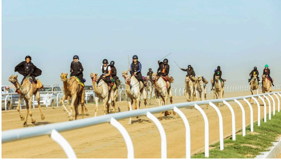
النساء يمارسن سباقات الهجن في الشرق الأوسط. (إكس)