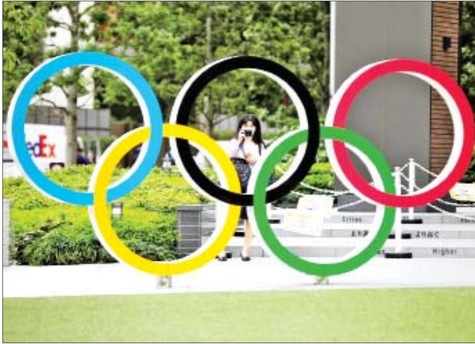
အားကစားသမားများသာမက ပွဲကြည့်ပရိသတ် များသည်လည်း ဗိုင်းရပ်စ်ပိုးသယ်ဆောင်သူများ ကြောင်း ဆေးဘက်ဆိုင်ရာ ကျွမ်းကျင်ပညာရှင်များက တာဝန်ရှိသူများအား တိုက်တွန်းပြောကြားသည်။

တိုကျို မေ ၂၉ ဂျပန်နိုင်ငံတိုကျိုမြို့၌ ကျင်းပမည့် အိုလံပစ် အားကစားပြိုင်ပွဲ ဘေးကင်းလုံခြုံစွာ ကျင်းပနိုင် ရေးအတွက် တာဝန်ရှိသူများက ဆောင်ရွက်လျက်ရှိ ကြောင်း သိရသည်။