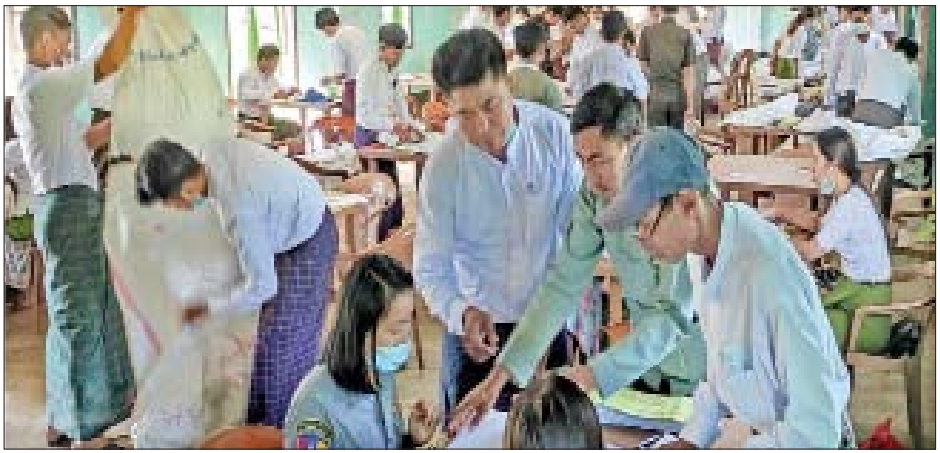
ဟုမ္မလင်းမြို့နယ် ဆန္ဒမဲလက်မှတ် မြေပြင်စစ်ဆေးမှု မှတ်တမ်းဓာတ်ပုံ။