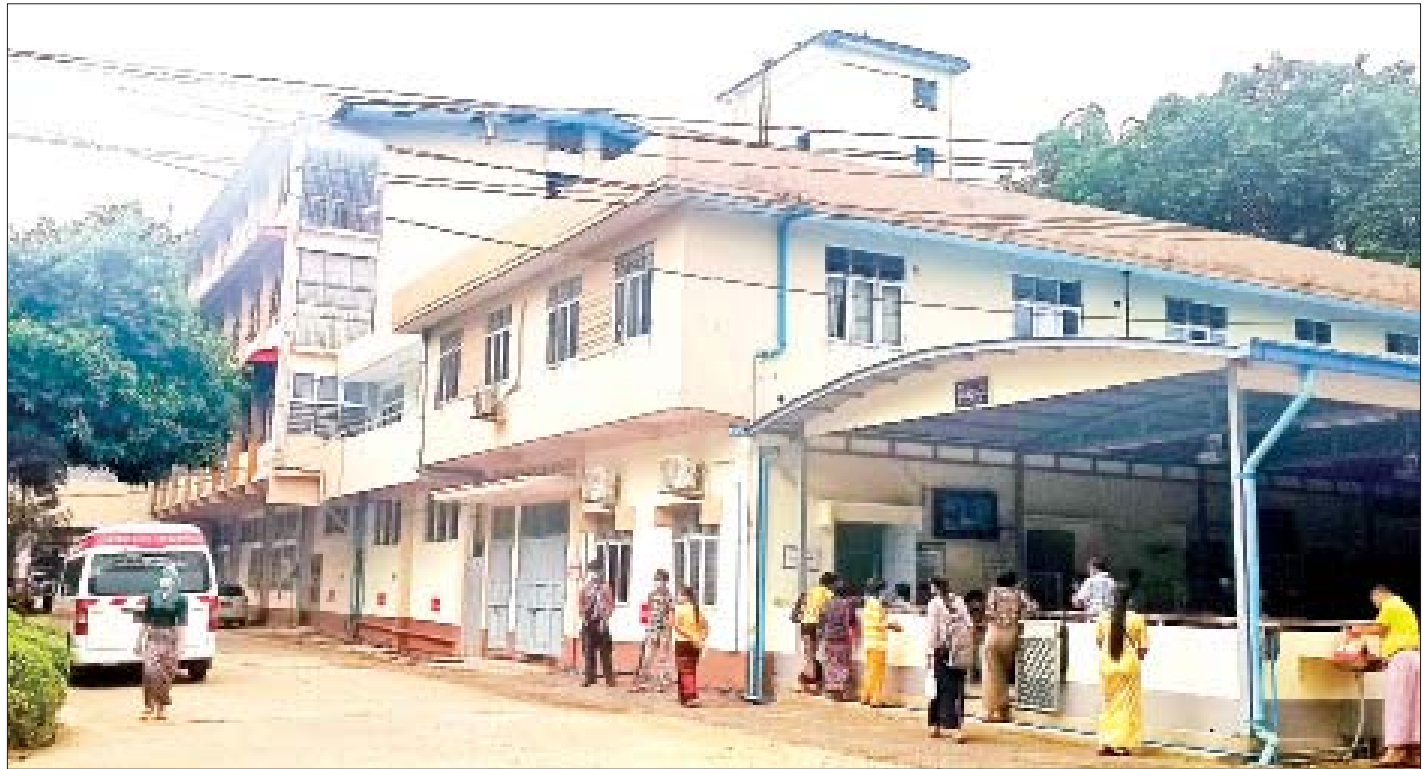
အလုပ်သမားဆေးရုံကြီး(ရန်ကုန်)ကို တွေ့ရစဉ်။