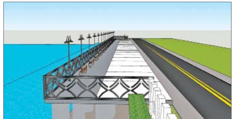
ညဈေးတည်ဆောက်မည့် ပုံစံကို တွေ့ရစဉ်။

အဆိုပါ ညဈေးတွင် ဆိုင်ခန်း ၅၀ ခန့် ပါဝင်မည်ဖြစ်ပြီး အစားအသောက် ရောင်းချသည့် ဆိုင်ခန်းများ၊ ဒေသထွက် ကုန်များ၊ အထိမ်းအမှတ်လက်ဆောင် ပစ္စည်းများ ရောင်းချသည့် ဆိုင်ခန်းများ ပါဝင်မည်ဖြစ်ကြောင်း သိရသည်။ “ညဈေးနဲ့ ဆက်စပ်နေတဲ့