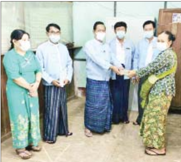
လယ်ယာဖွံ့ဖြိုးရေးဘဏ်သို့ ဆက်သွယ်ဆောင်ရွက်ကြရန် မြန်မာ့ လယ်ယာဖွံ့ဖြိုးရေးဘဏ်မှ သိရသည်။

ယခုနှစ် မိုးရာသီစိုက်ပျိုးစရိတ် ချေးငွေများကို ယခင်နှစ် မိုးရာသီ စိုက်ပျိုးစရိတ်ချေးငွေ ပြေကျေစွာပေးဆပ်ပြီးသူ တောင်သူ ဦးကြီးများအား ထုတ်ချေးပေးလျက်ရှိပြီး ချေးငွေများ ထုတ်ချေးပေးနေ စဉ် လာရောက်ပေးဆပ်သူ တောင်သူဦးကြီးများကိုလည်း ချေးငွေ ပေးဆပ်မှုလက်ခံ၍ စက်တင်ဘာလအထိ ဆက်လက်ထုတ်ချေးပေးသွား မည်ဖြစ်ပြီး ချေးငွေရယူလိုသော တောင်သူဦးကြီးများအနေဖြင့် မြန်မာ့