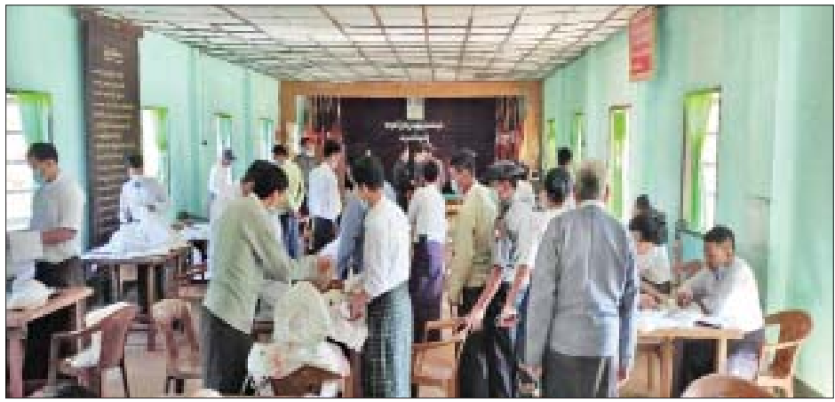
လေရီးမြို့နယ် ဆန္ဒမဲလက်မှတ် မြေပြင်စစ်ဆေးမှု မှတ်တမ်းဓာတ်ပုံ။