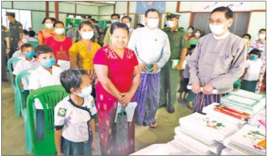
သစ်ပင်စိုက်ပျိုးပွဲနှင့် ကျောင်းအပ်နှံရေးနေ့ အခမ်းအနားကျင်းပ